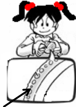
油胞(ゆほう)のつぶつぶ