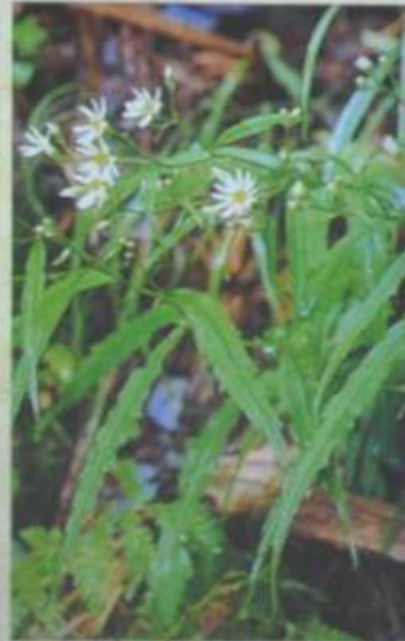
ナガバシロヨメナ