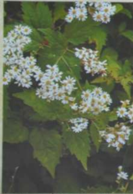
タマバシロヨメナ