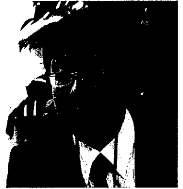
人事労政部 人事総括室長

新しい会社と一緒に歴史を作っていく熱意と、仕事を通して専門性や人間性を深めていく意欲にあふれた学生の皆様とお会いできることを楽しみにしております。