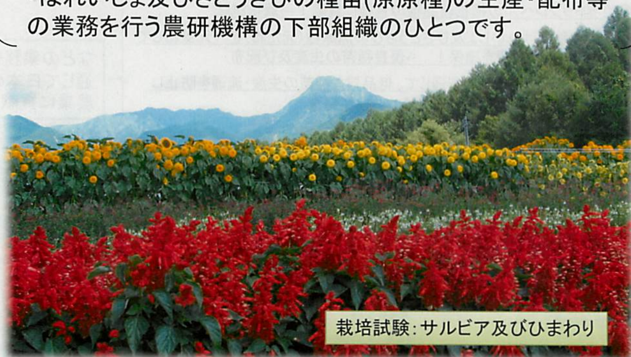
栽培試験: サルビア及びひまわり