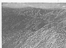
地質・物理探査系仕事風景