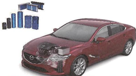
アルミ電解コンデンサ世界シェアNo.1! 世界初! 電気二重層キャパシタを自動車 (回生エネルギー用) 向けに供給開始!